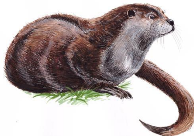
Fischotter Lutra lutra