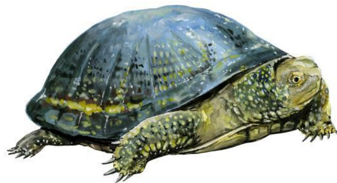
Żółw błotny Emys orbicularis