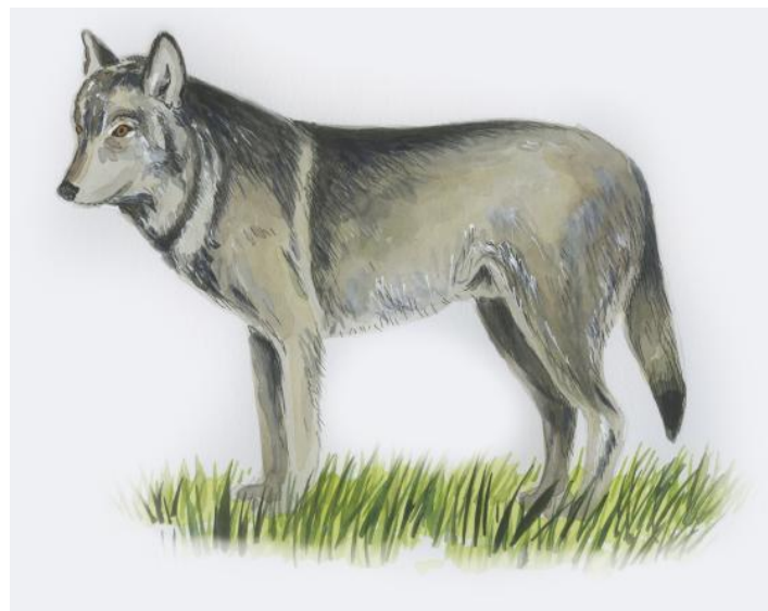
Wilk Canis lupus