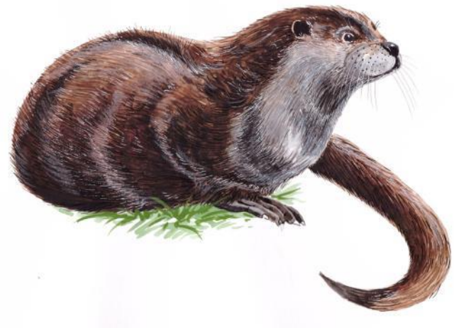
Wydra Lutra lutra